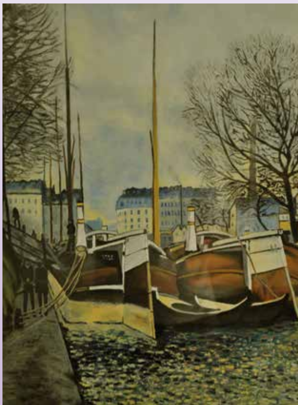
3. Da Alfred Sisley, Barche sul St. Martin Canal , (particolare), olio su tela, cm 92 x 92