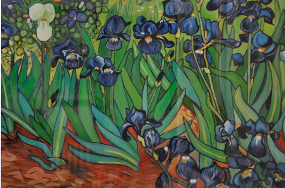
2. Da Vincent Van Gogh, Iris , olio su tela, cm 92 x 92