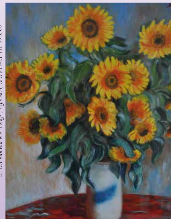
4. Da Vincent Van Gogh, I girasoli , olio su tela, cm 92 x 92